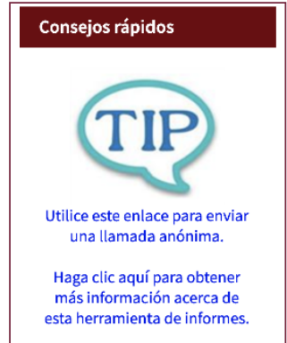
Imagen de el enlace de Consejos rápidos en el sitio web

Los consejos pueden ser anónimos, o puedes provenir la información de contacto. Se puede usar Consejos rápidos también, para archivar una queja de DASA, en que en este caso la información de contacto es obligatoria.